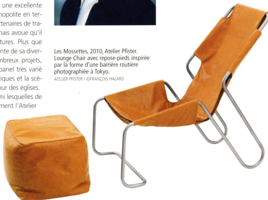
ATELIER PFISTER